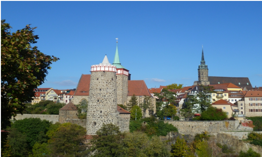
Bautzen - Hauptstadt der Oberlausitz