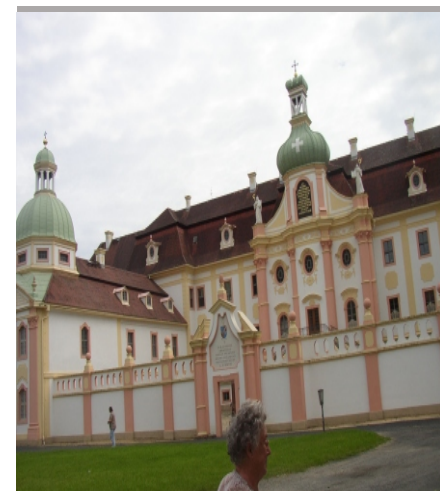
Kloster Marienthal Ostritz